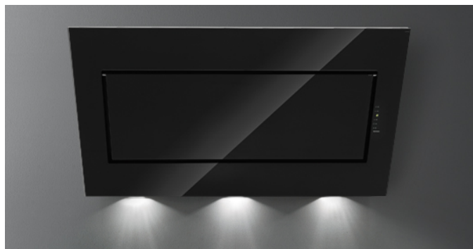
Фотографія призначена виключно в якості інформації Може не відповідати обраній версії.

Тип установки Настінна Габарити 120 см Покриття Покриття з чорного загартованого скла Шліфована нержавіюча сталь Двигун 800 м³/h Тип керування Сенсорне керування Налаштування швидкості 4 Освітлення LED 3x1,2 W – 3200 K Фільтр 3 x Metallic filter "Base" - 290x326 mm Вугільний фільтр Круглий вугільний фільтр Ø170 мм - Тип 6 (додатково) Мінімальна відстань Газова плита: 57 cm Електрична плита: 52 cm