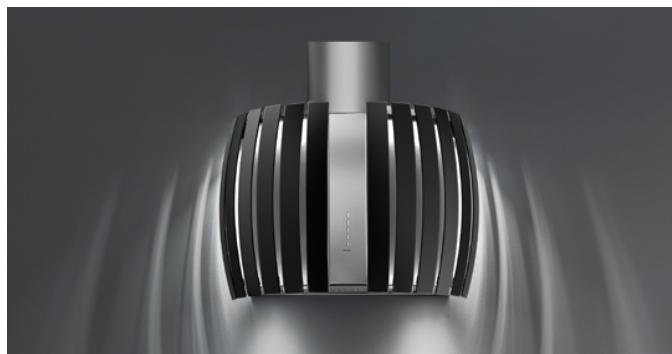
Фотографія призначена виключно в якості інформації Може не відповідати обраній версії.