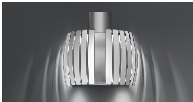
Фотографія призначена виключно в якості інформації Може не відповідати обраній версії.