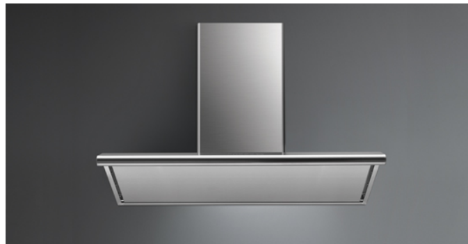
Photo à titre indicatif seulement Il ne peut pas répondre à la version sélectionnée