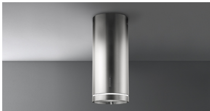
Fotografie cu caracter strict orientativ Aceasta poate sa nu corespunda versiunii selectate