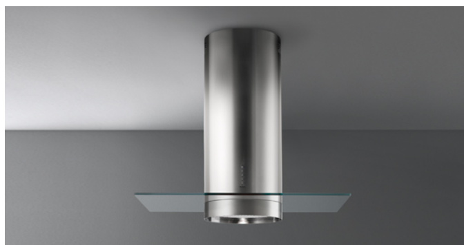
Фотографія призначена виключно в якості інформації Може не відповідати обраній версії.

Тип установки Настінна Габарити 35 см Покриття Шліфована нержавіюча сталь (AISI 304) Двигун 800 м³/h Тип керування Електронне керування Налаштування швидкості 4 Освітлення LED 3x1,2 W - 3200 K Вугільний фільтр Круглий вугільний фільтр Ø170 мм - Тип 6 (додатково) Мінімальна відстань Газова плита: 60 см Електрична плита: 52 см