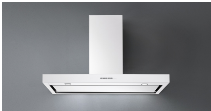
Фотографія призначена виключно в якості інформації Може не відповідати обраній версії.