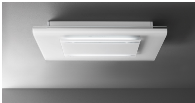
Фотография исключительно для информации Может не соответствовать выбранной версии.