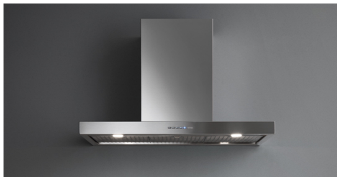
Фотография исключительно для информации Может не соответствовать выбранной версии.