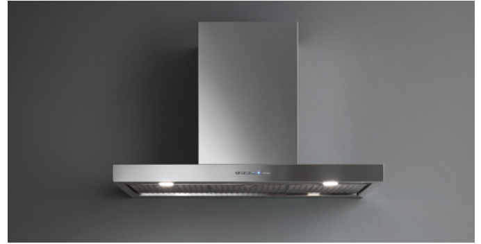
Das Bild dient rein einer groben Information. Es kann von der ausgewählten Version abweichen.