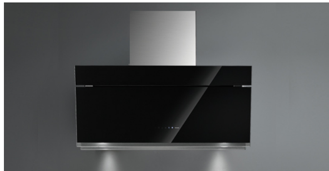
Poglądowe zdjęcie produktu Zdjęcie może dokładnie nie odpowiadać wybranej wersji