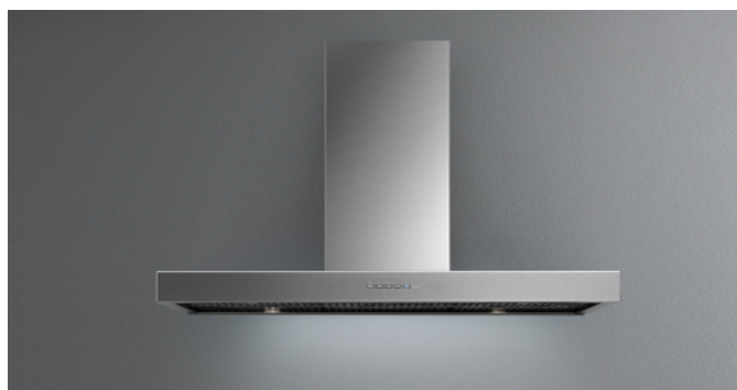
De foto is puur informatief Kan afwijken van de geselecteerde versie.