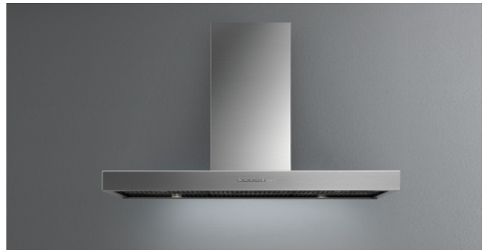
Fotografiet er udelukkende informativt Korresponderer ikke nødvendigvis tmed den valgte model