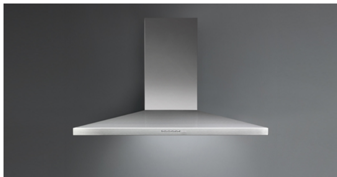
Immagine indicativa del prodotto Potrebbe non corrispondere alla versione selezionata