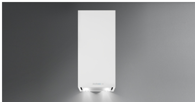
Фотографія призначена виключно в якості інформації Може не відповідати обраній версії.