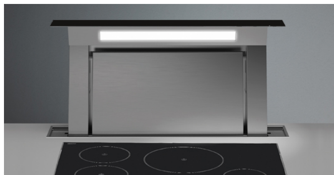
Das Bild dient rein einer groben Information. Es kann von der ausgewählten Version abweichen.