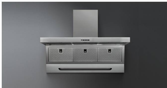
Immagine indicativa del prodotto Potrebbe non corrispondere alla versione selezionata