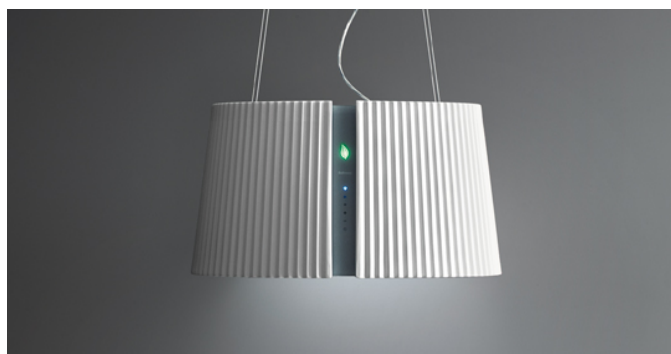
Fotografiet er udelukkende informativt Korresponderer ikke nødvendigvis tmed den valgte model