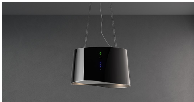
A fotografia é puramente informativa Pode não corresponder à versão selecionada