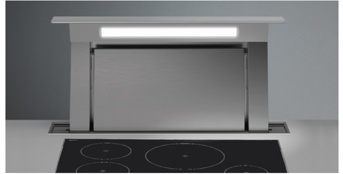
Das Bild dient rein einer groben Information. Es kann von der ausgewählten Version abweichen.