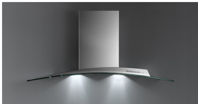
De foto is puur informatief Kan afwijken van de geselecteerde versie.