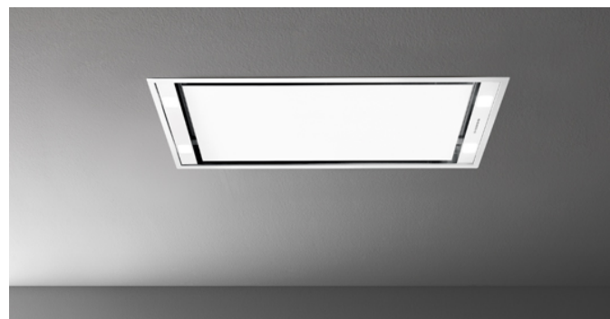
Poglądowe zdjęcie produktu

Zdjęcie może dokładnie nie odpowiadać wybranej wersji