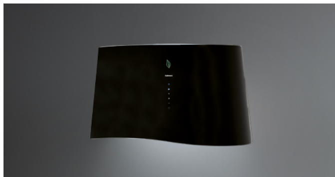
Immagine indicativa del prodotto Potrebbe non corrispondere alla versione selezionata