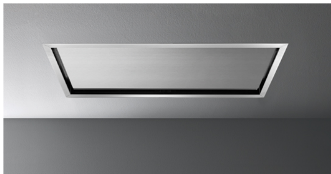
Fotografie cu caracter strict orientativ Aceasta poate sa nu corespunda versiunii selectate