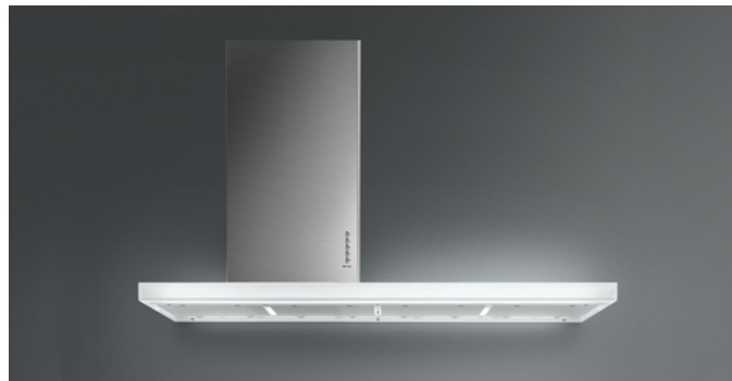
A fénykép csak tájékoztató jellegű Lehet, hogy nem felel meg a kiválasztott változatnak.