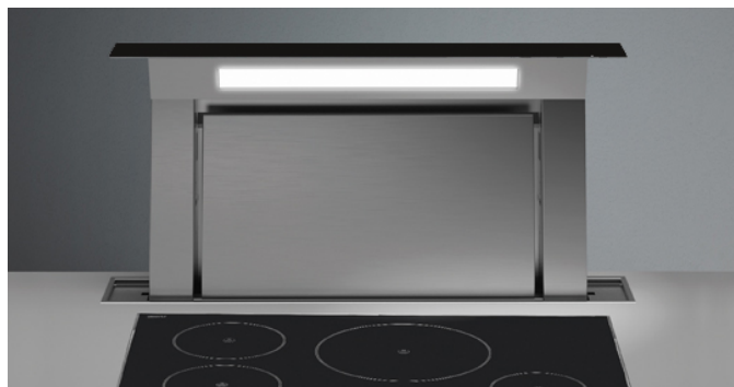
Das Bild dient rein einer groben Information. Es kann von der ausgewählten Version abweichen.