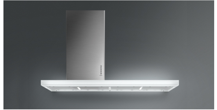
A fénykép csak tájékoztató jellegű Lehet, hogy nem felel meg a kiválasztott változatnak.