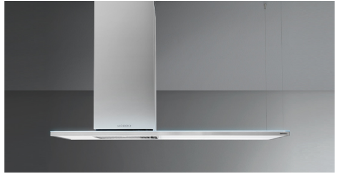
Фотографія призначена виключно в якості інформації Може не відповідати обраній версії.