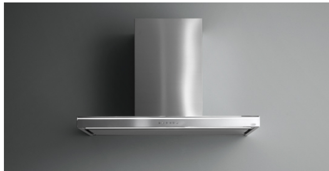
De foto is puur informatief Kan afwijken van de geselecteerde versie.