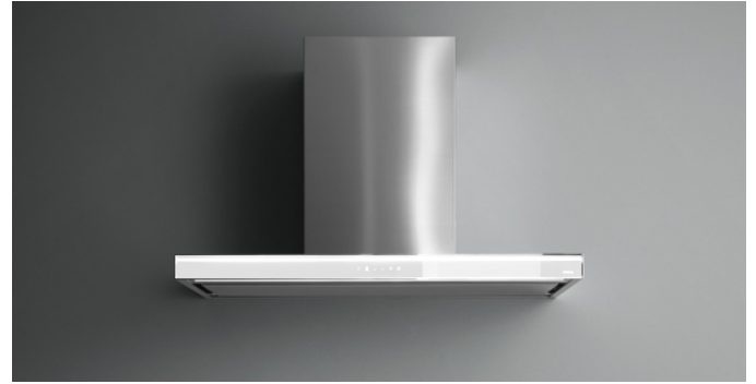
De foto is puur informatief Kan afwijken van de geselecteerde versie.