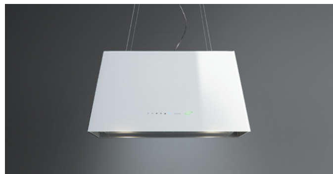
Poglądowe zdjęcie produktu Zdjęcie może dokładnie nie odpowiadać wybranej wersji