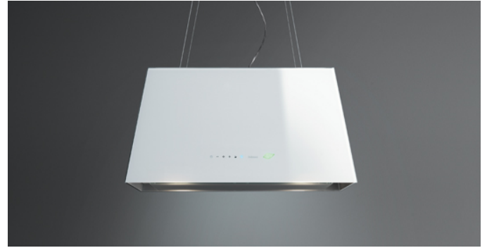
Das Bild dient rein einer groben Information. Es kann von der ausgewählten Version abweichen.