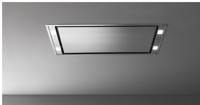
Fotografie cu caracter strict orientativ Aceasta poate sa nu corespunda versiunii selectate