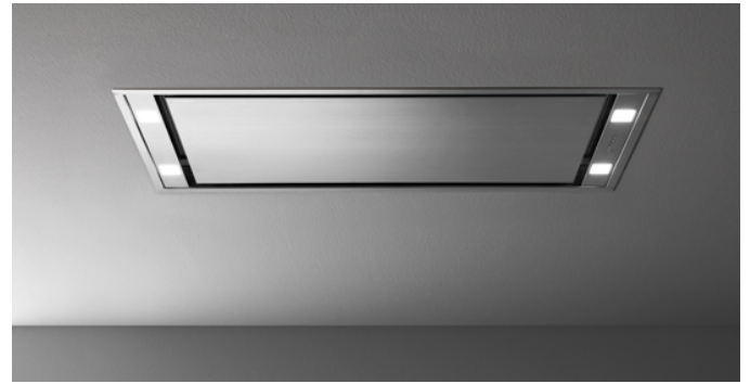
Photo à titre indicatif seulement Il ne peut pas répondre à la version sélectionnée