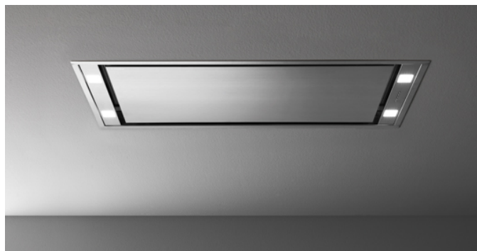
Fotografiet er udelukkende informativt Korresponderer ikke nødvendigvis tmed den valgte model