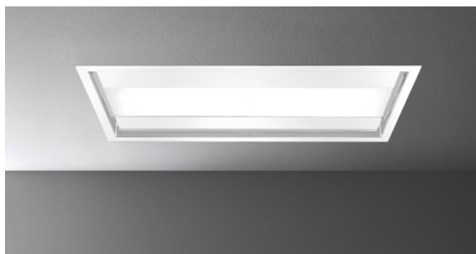
Immagine indicativa del prodotto Potrebbe non corrispondere alla versione selezionata