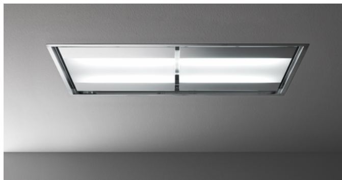
Fotografie cu caracter strict orientativ Aceasta poate sa nu corespunda versiunii selectate